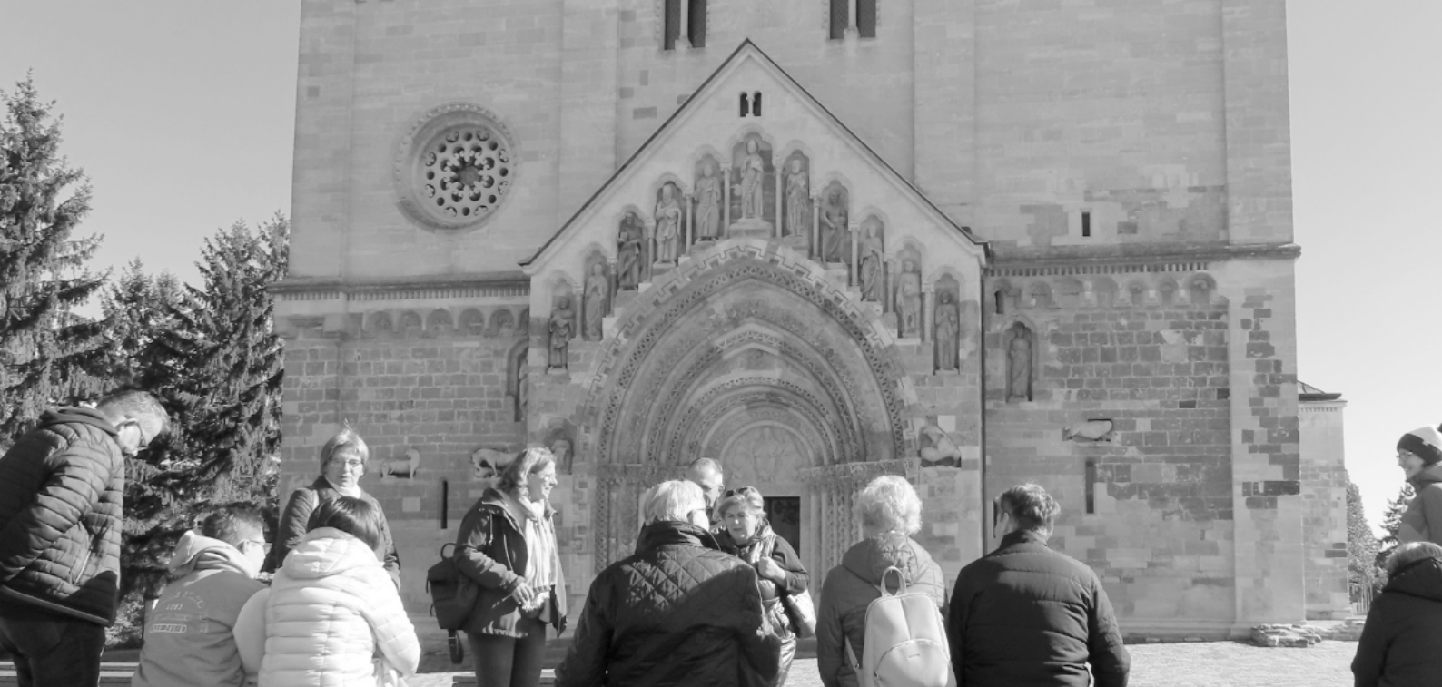
A jáki templom előtt