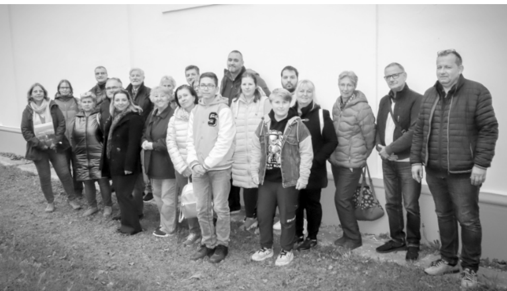
Gyülekezetünkől húszan vettünk részt az őrségi kiránduláson