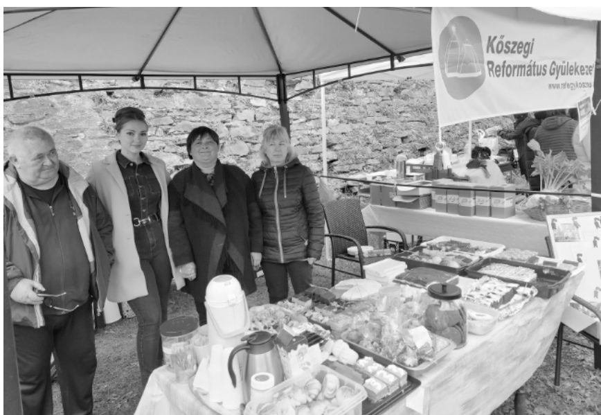
Gyülekezetünk sátra önkénteseinkkel a vásáron